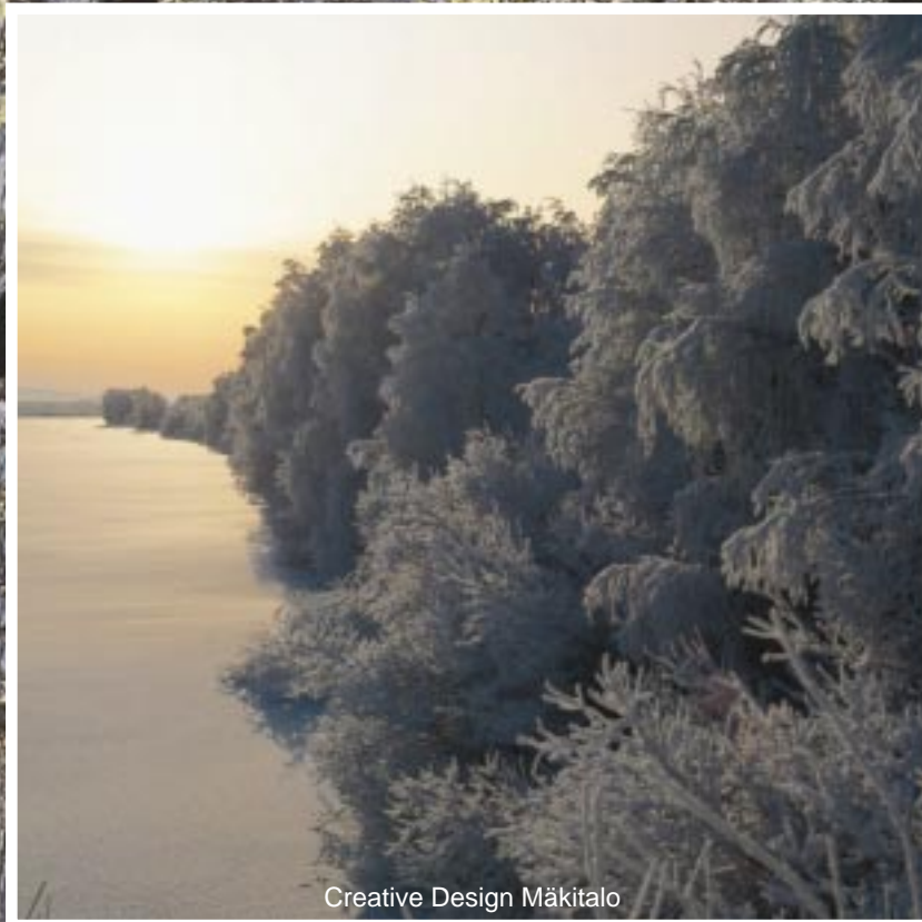
Creative Design Mäkitalo